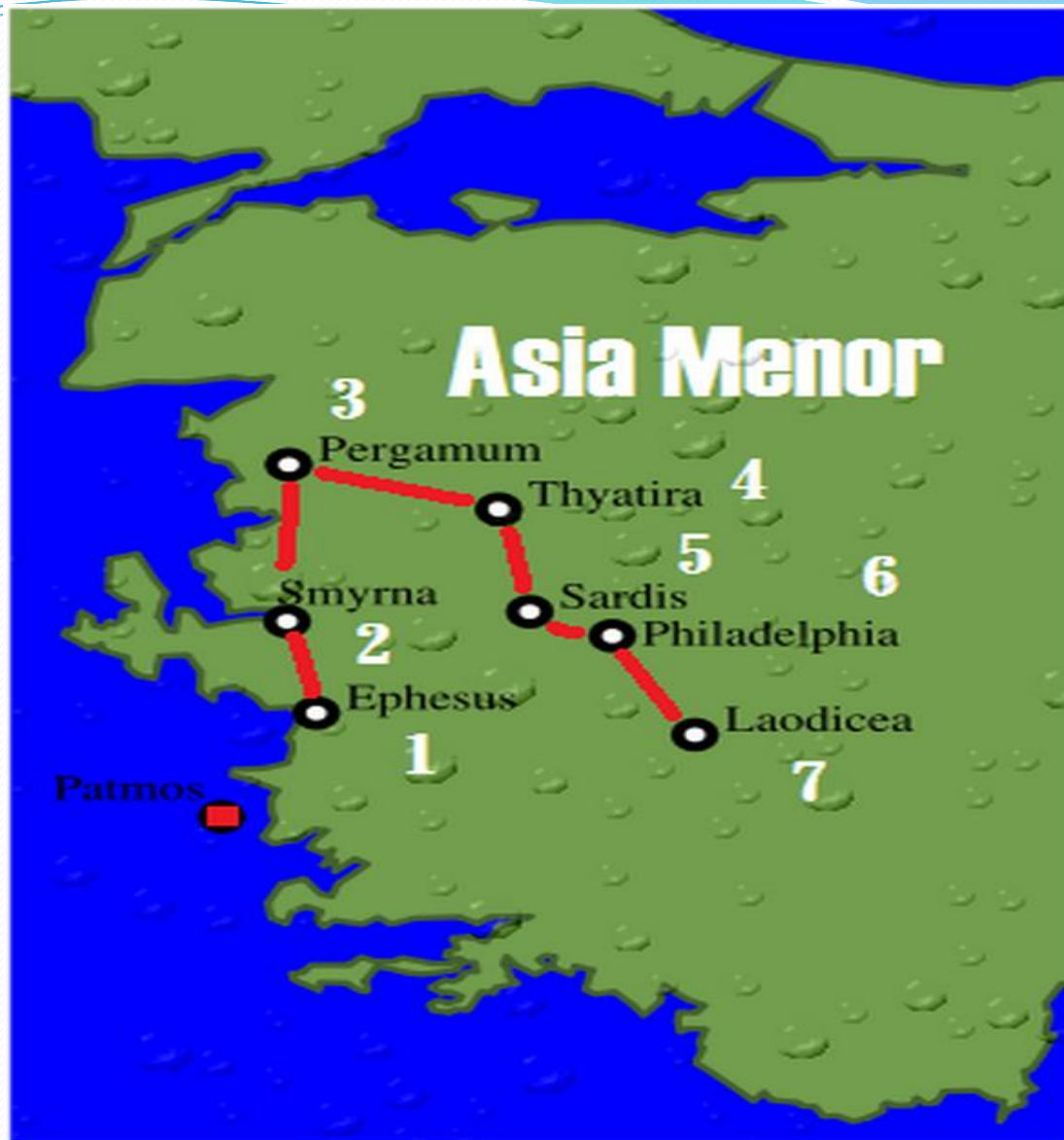
7 IGLESIAS DE ASIA MENOR